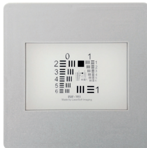
Target de Resolución de 35mm (USAF 1951) de SilverFast

Puede encontrar más información sobre los Targets de Resolución (USAF 1951) de SilverFast, así como una guía detallada, usos y fondos adicionales en: www.SilverFast.com/Resolution-Target